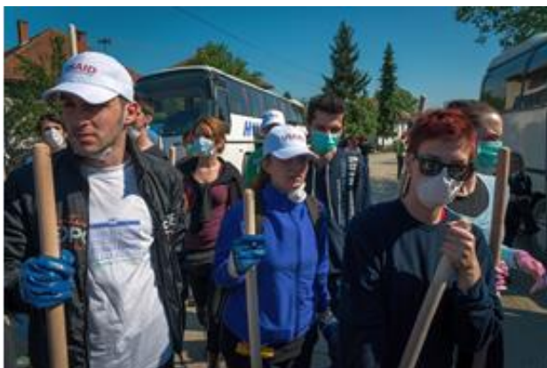
Volonteri USAID-a u Maglaju pomazu u rasciscavanju blata nakon poplava u maju, 2014.

Američka vlada je osigurala više od 2,5 miliona dolara humanitarne pomoći za saniranje posljedica uzrokovanih poplavama, uključujući i 26 čamaca za spašavanje tokom prvih 24 sata od objave stanja prirodne nepogode, čime je omogućeno spasavanje stotina života. Sada je počeo težak zadatak oporavka.