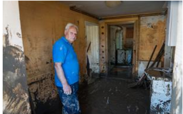
Stanovnik Maglaja u kuci nakon poplava iz maja, 2014.

Tokom slijedećih devet mjeseci, projekat FIRMA 2 će podijeliti 1,7 miliona dolara u obliku malih grantova kako bi se u područjima pogođenim poplavama pomoglo malim preduzećima da ponovno počnu sa